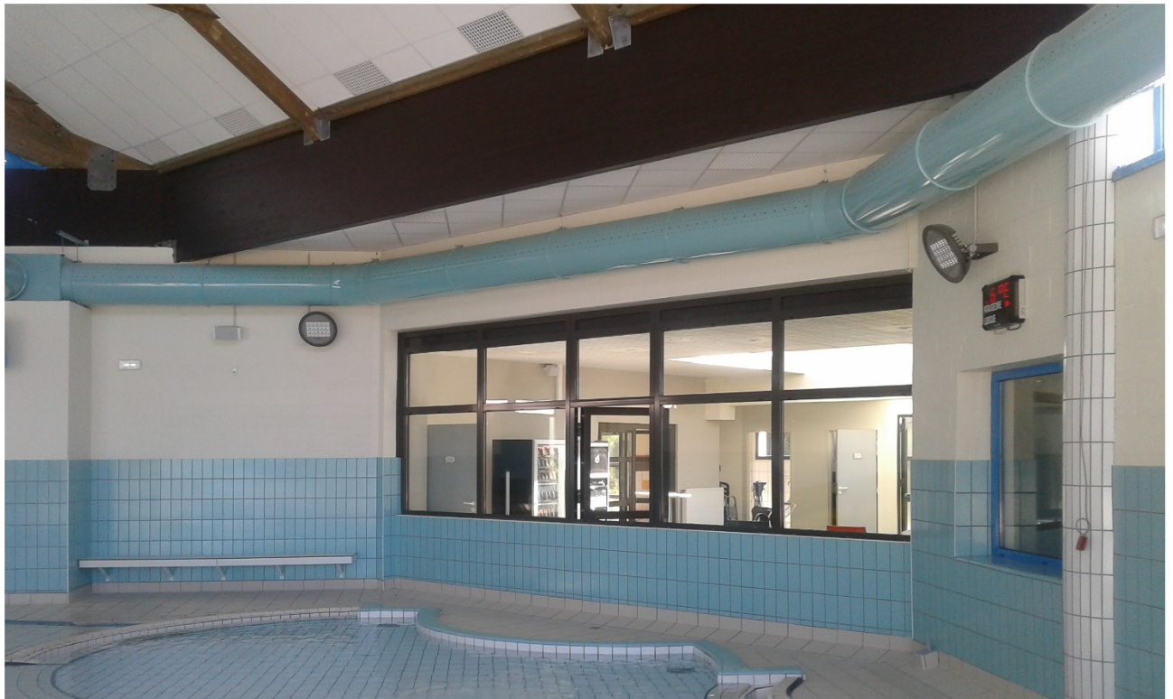
REFECTION ZONE BASSINS