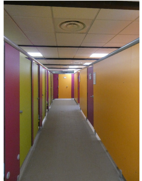
ZONE VESTIAIRES PUBLIC