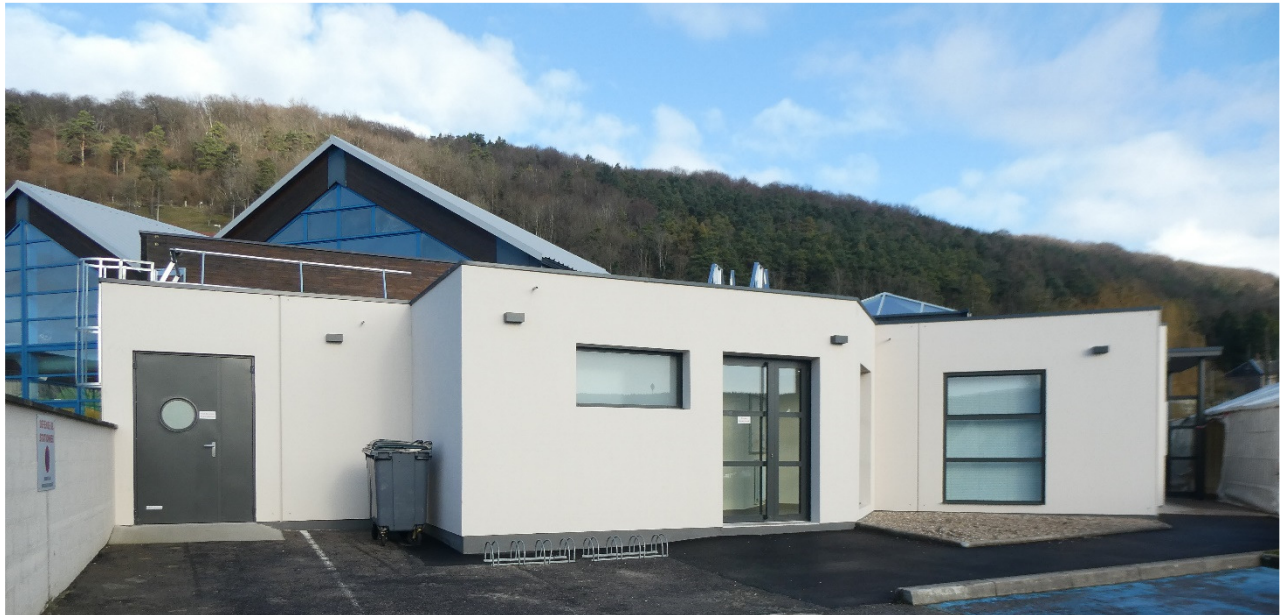
VUES EXTERIEURES SUR EXTENSIONS